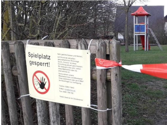
Spiel- und Sportplätze gesperrt...