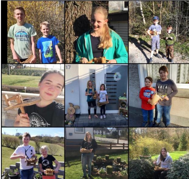
Klespern im eigenen Garten...