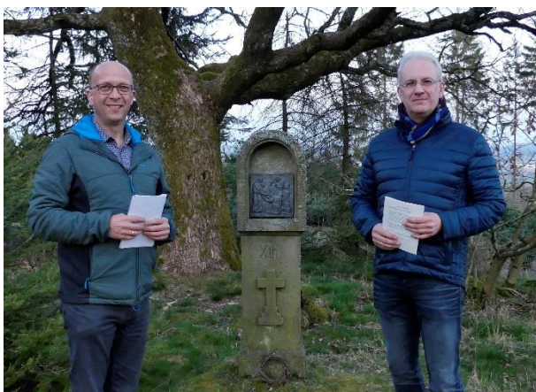
Kreuzweg auf youtube...