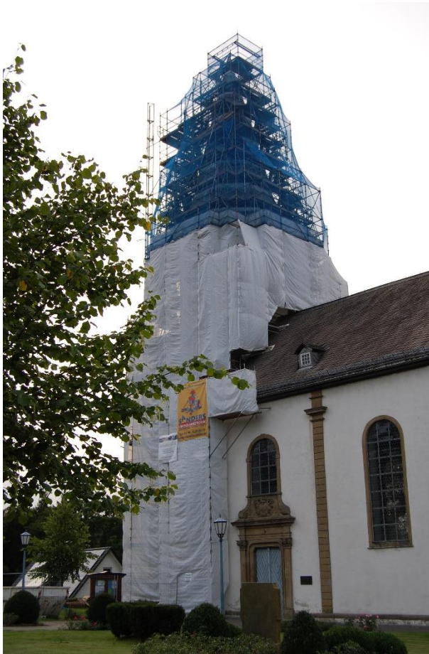
2010 war der erste Sanierungsabschnitt (s. Foto) beendet – erste Mängel am Turm traten aber bereits 2012 auf

Nach verschiedenen Gutachten und jahrlangem Rechtsstreit, hat im Juni 2020 eine Gerichtsverhandlung im Landgericht Arnberg stattgefunden.